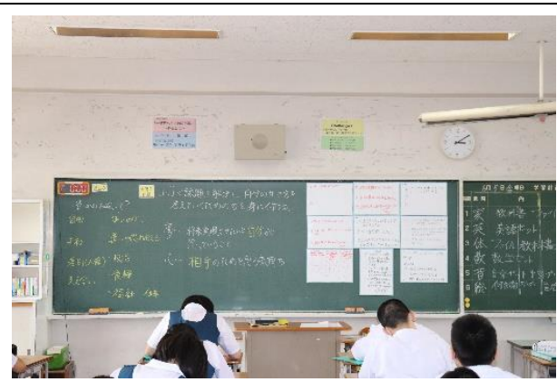
総合的な学習の時間「未来に向けて今できること（SDGs）」（1年生）