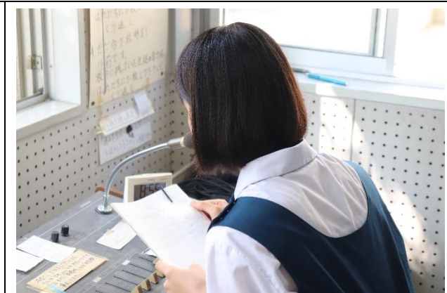
放送による始業式（校長先生，生徒会長）